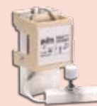
2500 W • Cód. 0357/03