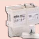
3000 W - Cód. 3959/03