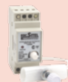
1500 W - Cód. 0354/03